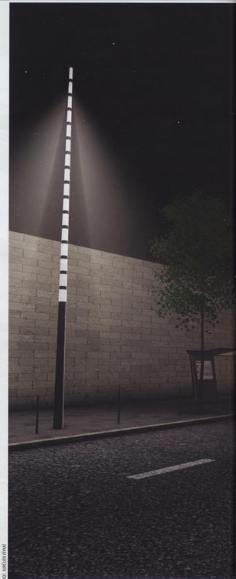
DOC. AURÉLIEN VEYRAT